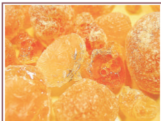
Gomme arabique purifiée

Sur les vins rouges, la complexité des polysaccharides neutres de Suavigum participe à la stabilisation chromatique et colloïdale. Les sensations végétales et dures des tanins extraits lors de macérations trop longues, ou issus de raisins n'ayant pas atteint la maturité phénolique, sont fortement atténuées. Lors des dégustations comparatives, les vins se révèlent plus harmonieux avec des tanins plus fondus, et des notes fruitées, sucrées particulièrement agréables à la dégustation.